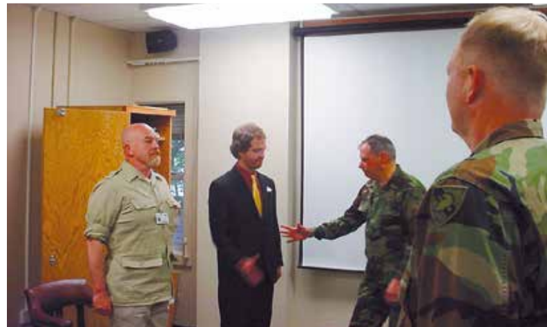
Slavnostní předání vyznamenání velitele West Pointu.