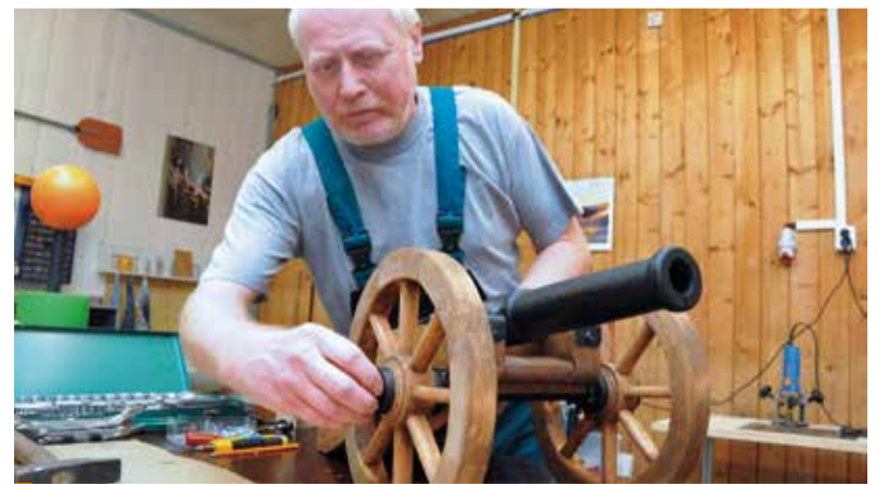
Dělo – připomínka původního využití Pevnosti poznání.

Návštěvníci se zde projdou například modelem mozku nebo korytem řeky s hmyzem v nadživotní velikosti. Součástí muzea budou také laboratoře, ateliéry a tvůrčí dílny. (srd)