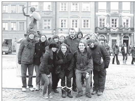
V centru Varšavy