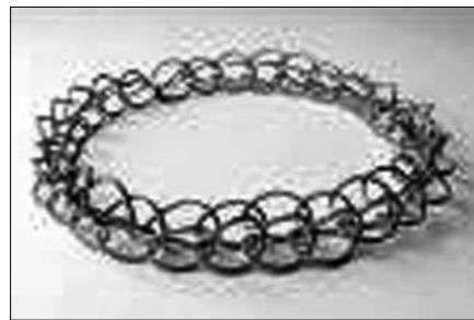
▲ Anonym: Náhrdelník, 2006

Výstava „Šperk sedmkrát jinak“ bude zahájena vernisáží 2. 11. a potrvá do konce listopadu. Vstup do galerie Studio LR (Malostranské nábřeží 1, Praha 1) je zdarma.