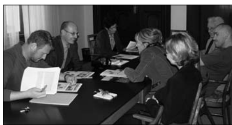
▲ Diskuse o budoucí podobě Žurnálu UP bývá často předmětem jednání jeho redakční rady a hostů