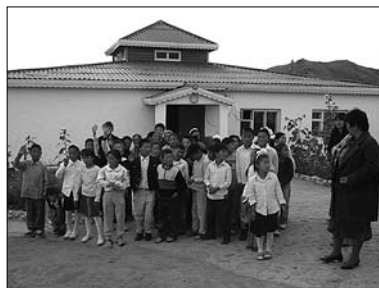
▲ Děti před školou