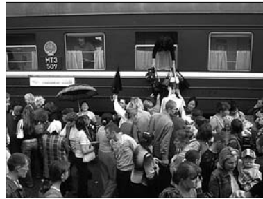
▲ Lidský mumraj při prodeji na nástupišti

Už chápu, k čemu slouží ta ohromná zavazadla, jež Mongolové tak uprtně cpali v Moskvě do vlaku: V momentu, kdy vlak zastaví na jakémkoliv nádraží Transsibiřské magistrály, stává se z nástupiště jedno obrovské tržiště s neskuptečným lidským mumrajem. Podnikaví Mongolové prodávají všechno, co v Moskvě naložili. Někteří z vlaku vyskočili dokonce ještě za jízdy, aby „chytli“ dobrá místa, jiní obchodují přímo v otevřeném okýnku kupé. Vlak má pevně daný jízdní