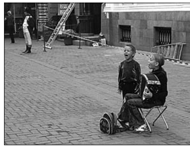
▲ Zpívající děti

Když máma se synem druhý den z vlaku vystoupí, stává se kupé průlezkou pro děti... Chodí si s námi „pagavariť“. A konverzace se