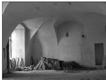
▲ Jedna z učeben v barokní školní budově staré olomoucké univerzity, nyní rekonstruovaná pro účely depozitářů Vlastivědného muzea v Olomouci. Foto J. Fiala

Z jiných záznamů v rektorském diariu P. Leopolda Henndta uvedeme tři. Zajímé záznam z 6. listopadu 1700, z něhož lze usuzovat, že se v jezuitských refektářích do té doby servirovaly i nápoje exotické provenience: „Sabbatum. Sub prandio lecta ordinatio P is N o Generali de abolendo haustu Cokoladae, Thee, e' Caffee. (Před obědem