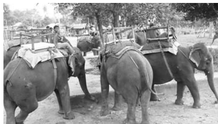
Mezi nevěšdní zážitky patřilo i koupání se slony v řece během výletu do rezervace

Jako všude. Neposedné, zlobivé, ale i zvědavé a snaživé. Někteří jsou lepší, některým jde učení hůře. Bohužel ne všechny děti mají ke vzdělání přístup. Státní školy sice nejsou zpoplatněné, ale děti si musí samy kupovat učebnice, uniformu a musí platit za ročníkové zkoušky, což je občas velký problém, zvláště pokud má rodina kolem pěti dětí. Někteří děti žijí i několik