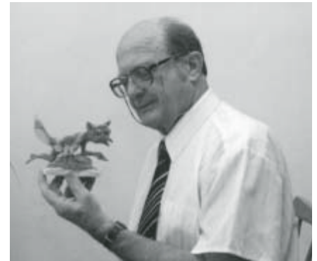
„Chramostejlik“ (pro M. Hornička k jeho osmdesátinám), jalovec čínský