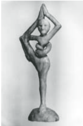
Na uzeli (Nodasan aneb jogín), ořešák (J. Tillichovi)

Zrod dřevíčka má řadu fází, z nichž jedna nemusí navazovat bezprostředně na jinou. Na počátku bývá získání materiálu: najdu ulomenou větev, jindy si vyžádám při úpravě parkové zeleně od zahradníků kus