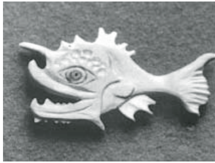
Tmorybka pekelná ( Spinichthys infernalis ), cypríšek

Silnější kusy větví je vhodné rozdělit několika podélnými řezy, aby se snížilo vnitřní pnutí a veškerý čerstvý materiál je pak nutno nechat vysychat co nejpozději, třeba tak, že dřevo zabalíte do igelitové folie. Po několika dnech zjistíte, že dřevo nerozpraskalo, nýbrž zplesnivělo a je celé mokré vypocenou mizou. I očistíte povrch vlhkým kartáčem, igelit vyperete a vysušíte, dřevo ponecháte den, dva na vzduchu a pak zase zabalíte. Po několikerém zplesnivění, očistění, osušení a opětném zabalení rezignujete buďto vy (a dřevo vyhodíte), nebo dřevo; to pak dále plesniví, ale už jen trochu, a může pomalu dosychat bez zabalení. To trvá minimálně několik měsíců, ale mám mezi svými zásobami i špaliky z dob velkého průklestu Smetanových sadů v roce 1968. Ještě před dosušením je možné (a vhodné) podélně nařezat dřevo na polotovary – destičky o síle 5 až 20 mm. Destičky zabalíte do prodyšných sáčků nebo uložíte do krabic, popíšete (druh dřeviny, letopočet, místo původu...) – a opět běží čas, dny, měsíce,