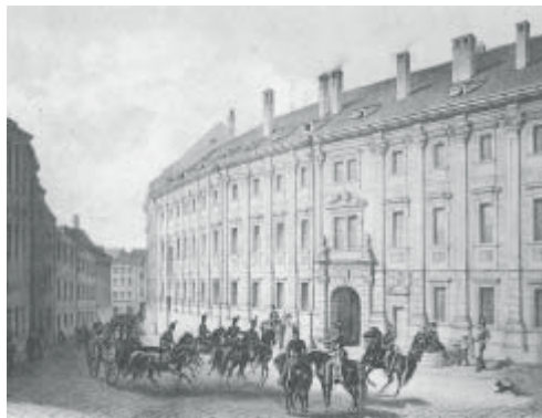
Budova bývalého jezuitského konviktu kolem roku 1860

Název připravované výstavy v olomoucké galerii Horká kaše 2 osloví patrně jenom pamětníky – zejména mezi studenty. Horká kaše (1) se totiž uskutečnila v květnu 1998, kdy jsme na čtyři dny otevřeli tehdy ještě prázdný a beznadějně mlčící jezuitský konvikt a olomoucké veřejnosti jsme jej poprvé představili jako vizi budoucího uměleckého a uměnovědného pracoviště UP. To už je hluboká minulost. V konviktu