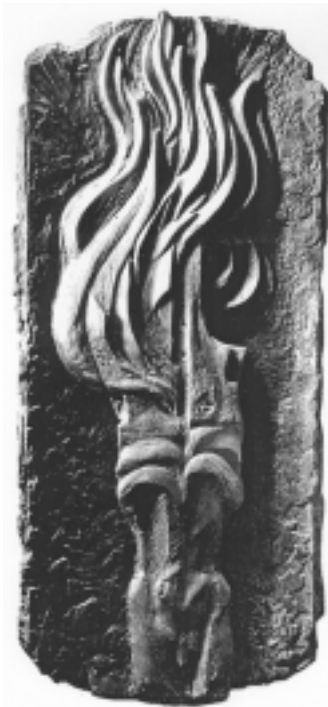
Reliéf hořícího těla navrhovaný k umístění na přejmenované koleji J. Palacha.