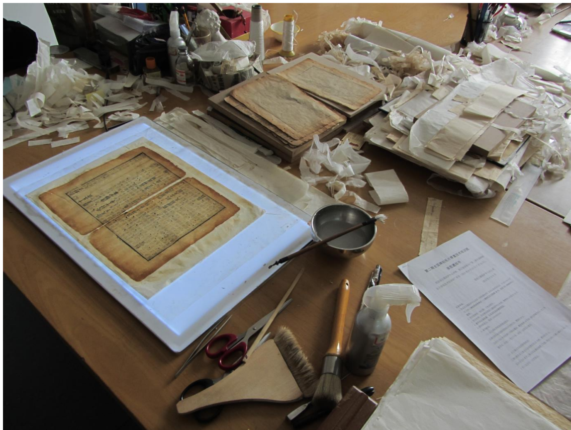
Obr.č.1: Oprava poškozených vzácných tisků v městské knihovně provincie Shaanxi

Budování vědeckého týmu a zapojování do mezinárodních sítí v oblasti čínských studií reg. č. CZ.1.07/2.3.00/20.0152